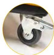
Koła z hamulcem